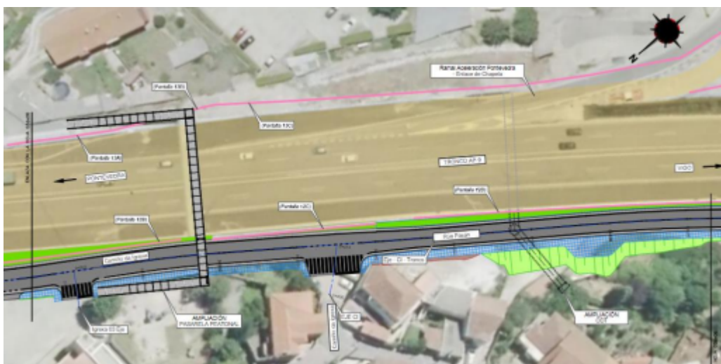
Detalle Rúa Pasán. Situación futura en el entorno del PK 150+800 de la AP-9

de San Fausto, para hacerla compatible con la actuación del viario y se amplía la obra de drenaje transversal que atraviesa la AP-9 en las proximidades del lavadero existente.